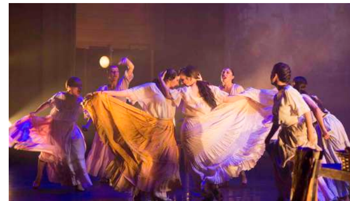
INTERIOR DE LA TABACALERA Primer Acto

Comienza la escena mostrando una plaza del mercado de Sevilla a las puertas de la Real Fabrica de Tabacos. Mientras suena la Aragonesa de Bizet se nos presenta al pueblo, a las cigarreras y a los personajes de Don José y Carmen, que tendrán su primer encuentro.