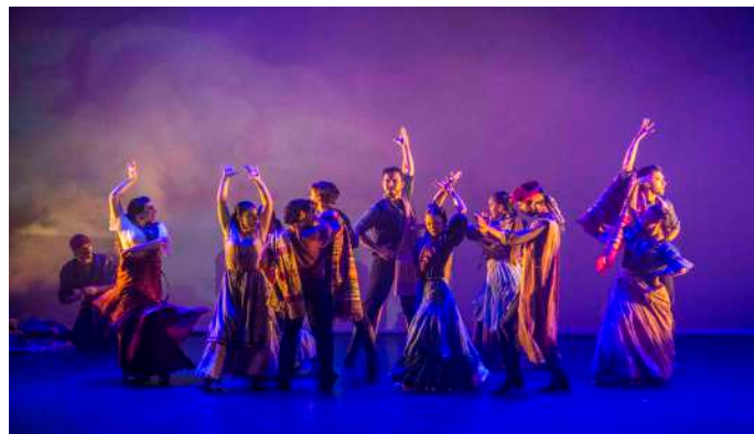
CAMPAMENTO DE LOS BANDOLEROS Segundo Acto

Una noche mientras espera aparece Carmen con el capitán. Éste, cegado por los celos, agarra su espada y se lanza contra el militar. La pelea acabará con el capitán muerto y José huyendo de su vida como militar y escapando a las montañas como un vil bandolero.