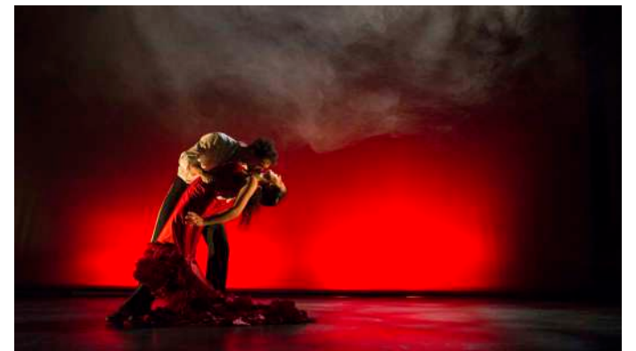
LA CARCEL Primer Acto

Ella conseguirá engatusar a José para ser liberada, lo que le costará al militar la degradación y entrada en el calabozo.