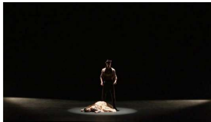
MUERTE DE CARMEN Segundo Acto

José hundido en la desesperación se marcha y se dirige a una ermita cercana a ponerse en paz con Dios. Tras analizar la situación descubre que la única manera de que Carmen no sea de nadie mas que de él es matarla.