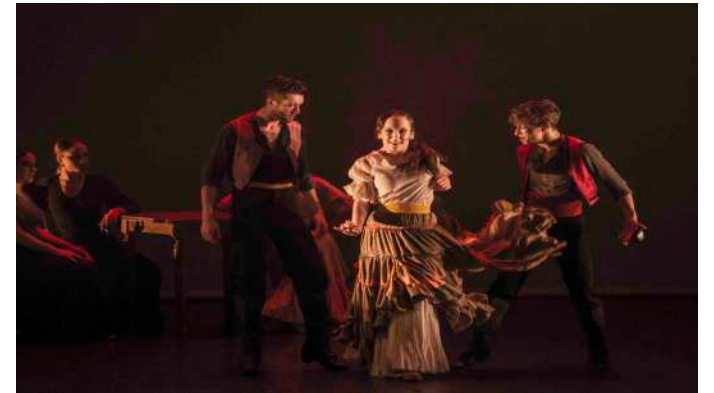
EL MERCADO DE SEVILLA Primer Acto

A modo de presentación veros una imagen del Carmen, que tras morir debe enfrentarse a los espectros de todos los hombres a los que engañó en vida. Entre tinieblas veremos claramente la desesperación de Carmen al enfrentarse al destino que ella misma escogió.