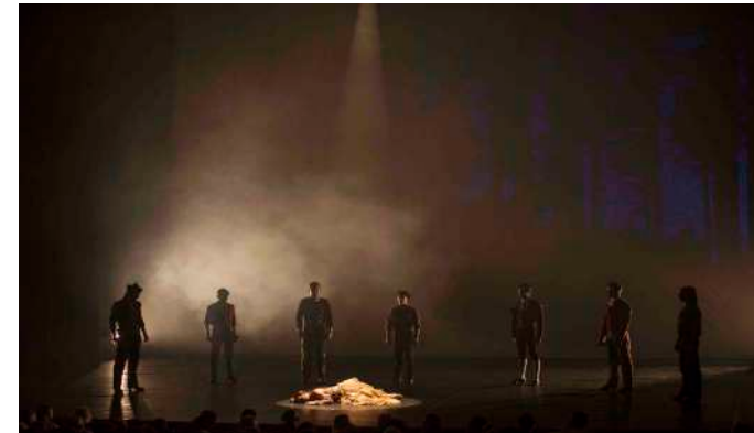
OBERTURA Primer Acto

A modo de presentación veros una imagen del Carmen, que tras morir debe enfrentarse a los espectros de todos los hombres a los que engañó en vida. Entre tinieblas veremos claramente la desesperación de Carmen al enfrentarse al destino que ella misma escogió.