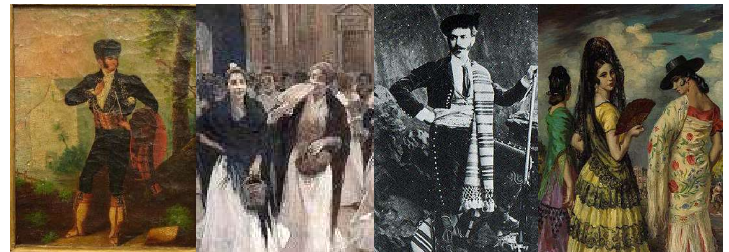
Imágenes de cuadros y grabados de la época que han servido de inspiración para la elaboración del vestuario de "Carmen de Mérimée"

Por otro lado, lo que aportará un sello de identidad a este montaje, será ese toque de inspiración árabe, nacido de la influencia que este pueblo dejó en la península. A partir de esta fusión de culturas, intentaremos recrear el carácter de cada uno de los personajes y del cuerpo de baile que intervienen en esta obra dramática. Esta influencia se podrá apreciar en algunas de las prendas de las gitanas y en especial en los personajes de Carmen y del torero, cuya personalidad irá reflejada a través de estampados y arabescos con aire mozárabe, recordándonos en algunos de los detalles a los entramados y cenefas de la Alhambra