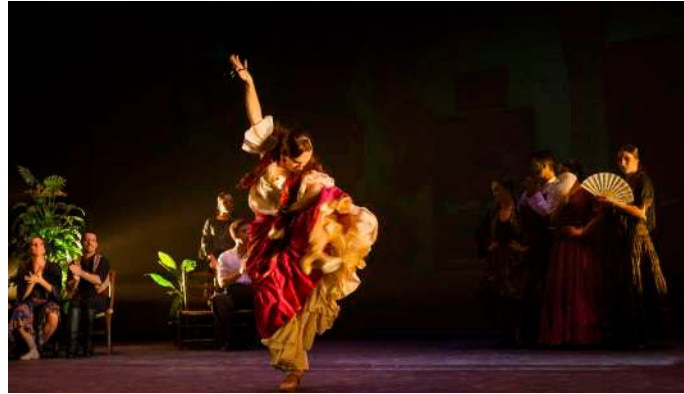
FIESTA DEL CORONEL Primer Acto

Tras salir de prisión José es puesto a guardar la casa de uno de sus superiores. Se celebra el cumpleaños del Capitán al que Carmen ha sido invitada como bailarina junto con la vieja Dorotea y un pequeño grupo de gitanos. En su danza ella no cesará de mirar a José, quien aumentará así su obsesión por ella.