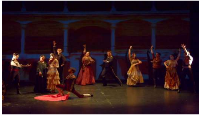
PLAZA DE TOROS DE CÓRDOBA Segundo Acto

El deseo de libertad lleva a la gitana a buscar mas encuentros con Lucas hasta el punto de llegar a enamorarse de él.