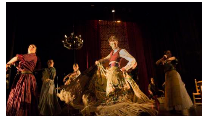
TABERNA EN GRANADA Segundo Acto

Siguiendo el plan de Carmen, José regresa al campamento gitano para esperar la caravana del Inglés. El plan reza que al verlos llegar, dejen adelantarse al Tuerto para que éste muera en la trifulca. Pero la noche previa a la cita, José en su obsesión de poseer a la gitana no puede evitar provocar al tuerto hasta el punto de enfrentarse en un duelo a cuchillo en el que éste último perderá la vida, quedando así Carmen libre de su esposo y siendo ahora mujer de José por derecho ante la ley gitana.