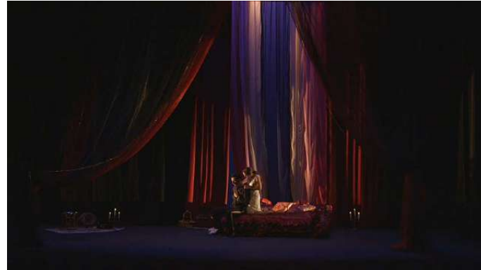
CASA DE LA VIEJA DOROTEA Primer Acto

Al final de la escena Carmen, al marcharse de allí, citará a José para tener su primer encuentro.