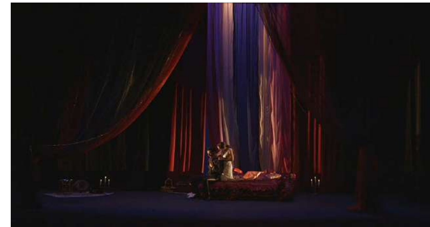
● Escenografía "La casa de la Dorotea"

y donde empieza nuestra historia, que es la historia de la cigarrera y del malogrado navarro Don José.