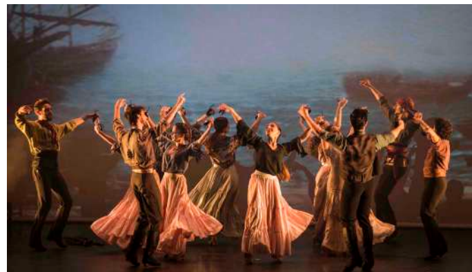
GIBRALTAR Segundo Acto

Una persecución en plena noche entre los bandoleros y la guardia nos presenta las montañas de Ronda y el escondite de los forajidos compañeros de Carmen, a los que se unió José. Carmen presenta a su marido "El Tuerto" que a partir de ahora será el rival de José por las atenciones de Carmen. Durante la fiesta de bienvenida, la gitana jugará a un continuo triángulo amoroso en sus danzas y toques de castañuelas entre su marido y su amante. Al amanecer, y tras despedirse únicamente de José y mientras el resto duerme, ella marchará a Gibraltar para buscar otra víctima de sus engaños.