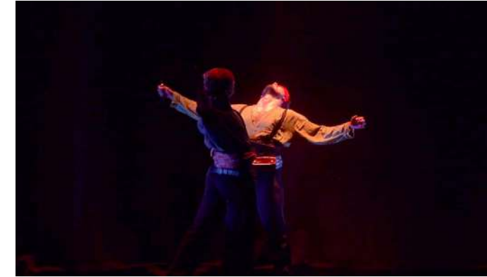
LA MUERTE DEL TUERTO Segundo Acto

José llega al puerto de Gibraltar buscando a Carmen, haciéndose pasar por un pobre comerciante. Tras mezclarse entre los trabajadores y participar del folclore y costumbrismo andaluz, entran en escena Carmen del brazo de un Lord Inglés, al que ella está utilizando para sus negocios. Tras encontrarse ambos, trazan un plan para robar y matar a este. Pero para sorpresa de José, el verdadero plan de Carmen también incluye que él mate al "Tuerto" para así poder ser por fin marido y mujer por la ley gitana.